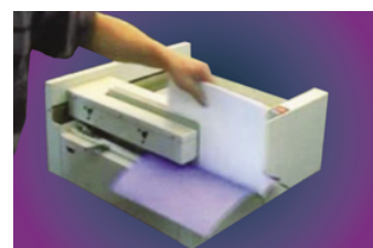
La reliure est terminée