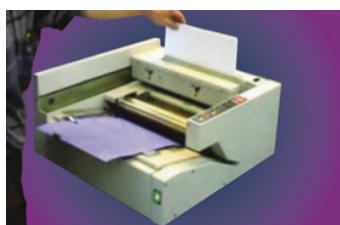
Mettre les feuilles dans le chariot

L' emboîtement motorisé s'adapte automatiquement sans nécessiter de réglages, quelle que soit l'épaisseur du document . Idéal pour les petites séries, ce thermorelieur combine efficacité, simplicité et qualité professionnelle.